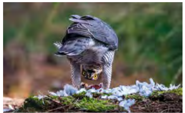
John de Graaf, zilver

Er waren meer loftuitingen. Het genre portret bevatte sterke karakterportretten, en portretten waarin een indringende gemoedstoestand werd ervaren. Enkele macro-opnamen wekten bewondering vanwege het zorgvuldig gekozen moment. Bij landschappen zag je soms dat 'meer' niet altijd 'beter' betekent. Sterk suggestieve en verbeeldende landschappen oogstten lof, door ruimtelijkheid of sfeer b.v., met minimale beeldonderdelen.