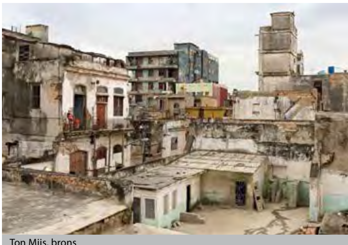
Ton Mijs, brons