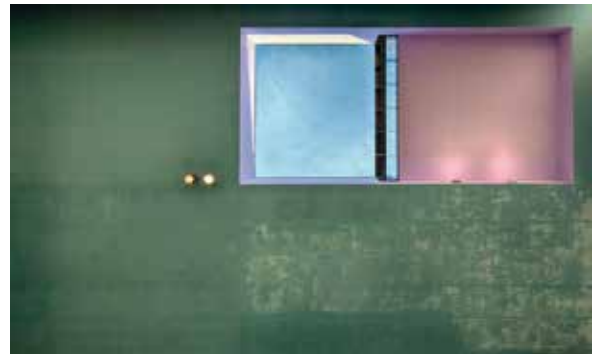
Arjan van Die, zilver

Er waren meer loftuitingen. Het genre portret bevatte sterke karakterportretten, en portretten waarin een indringende gemoedstoestand werd ervaren. Enkele macro-opnamen wekten bewondering vanwege het zorgvuldig gekozen moment. Bij landschappen zag je soms dat 'meer' niet altijd 'beter' betekent. Sterk suggestieve en verbeeldende landschappen oogstten lof, door ruimtelijkheid of sfeer b.v., met minimale beeldonderdelen.