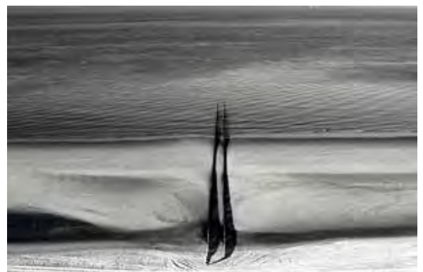
Willem Volkers, zilver