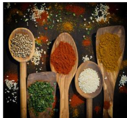
Mirjam Oosterhof - van Veen