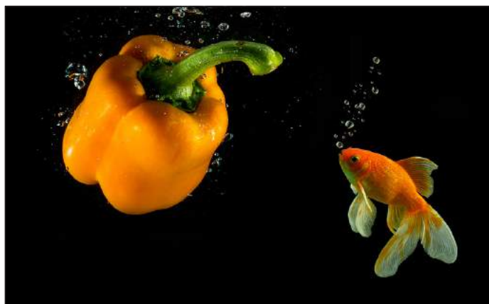
Cilia Oosterhof - Merkelijn