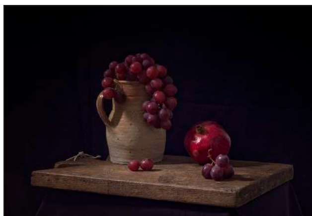
Rene van Rijswijk