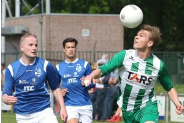
Martien van Dommelen Ze staan erbij en kijken ernaar

De fotograaf is vast en zeker trots op deze 'fotojachttrofee'. Een klik-ik-heb-je-gevoel zal overheerst hebben, waardoor in de vormgeving te veel zaken op de koop toe zijn genomen. Wacht tot de euforie enigszins bezonken is voordat je een beeld gaat bewerken. In dit geval zou de foto met een andere beeldduitsnede sterker zijn geworden.