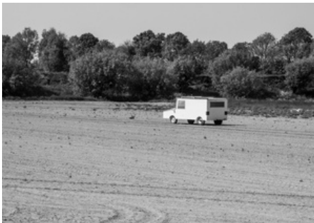
Rens Hubers Camper

Een van de foto's waar de reden van fotografie niet duidelijk voor mij wordt. De titel helpt me ook niet verder. 'Als een paal boven water' betekent 'Dat is een absolute zekerheid' Maar wat is 'dat' dan?? Ik krijg geen aanwijzing voor een verband tussen palen, water, damwand, touw en een ketting. Een gezegde verbeelden is prima, maar blijf dan niet steken in een registratie; zorg voor een fotografisch interessant beeld.