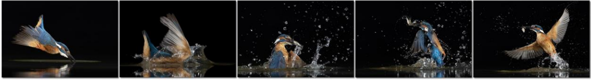
Toelichting Martina van Raad

Vele momenten heb ik doorgebracht in de natuur om de snelheid van een duik vast te leggen, met behoud van details. Er is een hoop voorbereidend werk nodig geweest om de ijsvogel op deze manier te fotograferen. Om de ijsvogel het vertrouwen te geven is er een volledige studio in etappes opgebouwd met accu's midden in de natuur. Voor mij was het geweldig om te zien hoe deze ijsvogel doorging met het vangen van vis, zonder zich wat aan te trekken van de vele lampen. Deze momenten van de ijsvogel met zijn prachtige kleuren, wilde ik heel graag vastleggen voor mijzelf en voor de kijker.