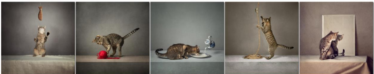
Toelichting Mariska Vereijken

De serie “kattengedrag” is ontstaan in een periode dat ik zelf als fotograaf het studiowerk (oa het werken met flitsers) aan het uitvinden ben, én wij de trotse eigenaars zijn geworden van deze poes. Door het plaatsen van een vooraf bedachte setting en af te wachten hoe de poes hier op reageert is deze serie ontstaan.