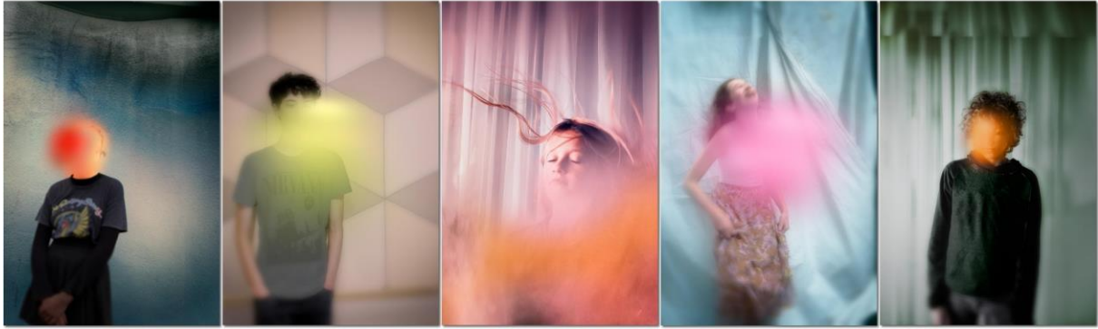
Toelichting Joty Biegel

Deze serie met de titel “teenage mood” heb ik gemaakt door mijn fascinatie voor de verschillende en snel veranderende gemoedstoestanden van pubers. Denk aan verveling, verliefdheid, te veel energie, passiviteit, opstandigheid en nog veel meer. Ze moeten er mee omgaan en de een lukt dat beter dan de ander. De puberteit is dan ook vaak een lastige periode voor jongeren.